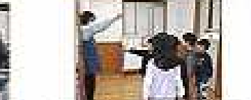
小学生チャレンジ