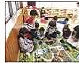
みんなで遊んだよ!