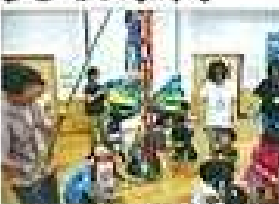
じょうずにわれました