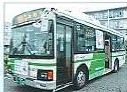
現在運行しているバス

住吉島の狭い道を大きなバスが走っているのを見たことがあると思います。ずっと昔から走っているこのバスに皆さんは乗ったことがありますか? このバス路線は、徳島駅を経由して徳島商業高校と地藏院を結ぶ17号路線と呼ばれています。平日は4往復しています。「乗る人が少ない赤字路線のはずなのに、どうしてなくなるのだろう?」「どんな人が利用しているのだろう?」などの疑問がわき、調べてみることにしました。