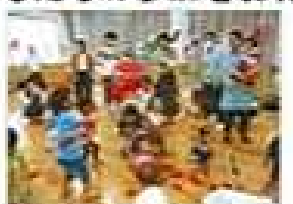
最後にくす玉わりをしました