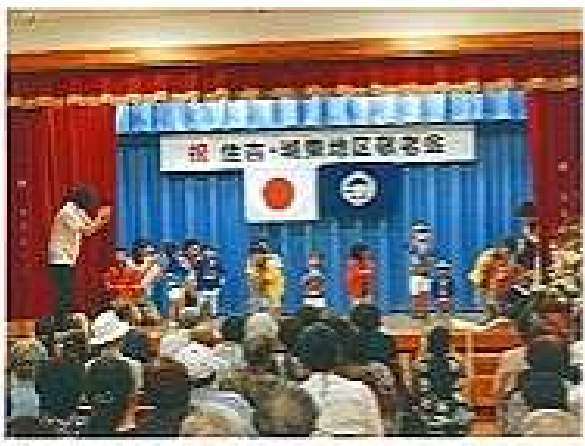
平成30年度地区敬老会の余興 児童館の子どもたちによる 可愛いダンス

感謝をいめて」の題で自分の祖父母のことを話ってくれました。大切に育ててくれたこと、なかなか寝ないのですと抱いてくれていたこと、おいしい食事を作ってくれ、お風呂に入れてくれたこと、野菜の収穫やカレーなど料理の作り方、野球のバットの振り方まで教えてくれたこと。時々反抗し