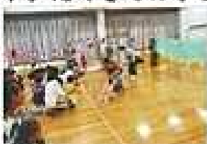
「ボボちゃんとおさんぽ」の時の様子です