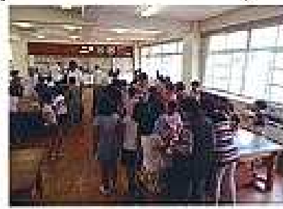
サポーターズクラブ「音の遊び」と「住吉音頭交流会」の様子

また、地域の学校や幼稚園・保育園に向いての「サポーターズクラブ」や「地域学遊塾」も実施します。これらの事業は、大人と子どもが昔の遊びや住吉音頭等の体験教室を通して交流するものです。子どもたちに公民館を身近な存在と感じてもらえればと考えています。