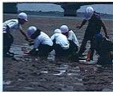
干潟で生き物を探す児童たち

2018年度「みどりの日」自然環境功労者環境大臣表彰の「自然ふれあい部門」に、20年以上吉野川の干潟観察会や清掃に取り組んできた城東小学校が選ばれました。