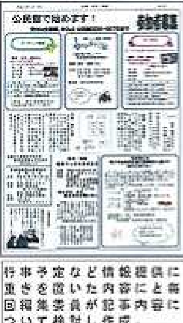
公民館で始めます！ 情報誌の作成 編集委員が作成 記事の重なりについて

共同募金へご協力を！ 【平成28年度住吉・城東地区募金額】1,326,000円 でした。 毎年10月からご協力をお願いしています。なお、お寄せいただいた募金については、地域福祉事業の支援などに配分されています。住吉・城東コミセンで募金をお預かりしています。ご理解とご協力をお願いいたします。