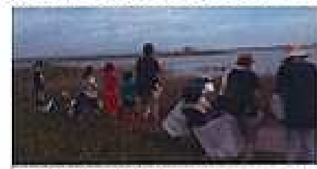
干潟清掃、生き物観察に行ってきました。とても楽しかったです。

今年の夏は厳しい暑さが続いています。児童館でもひと休みする時間をとったり、水分を十分にとるなどの注意をしています。8月、9月はたくさんの行事を予定しています。みんなで楽しいことをいっばいしましょう！来館をお待ちしています。