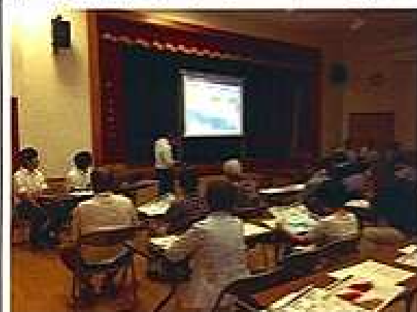
7月8日(土)第1回津波避難計画策定検討会で徳島市担当者が趣旨説明(住・城コミセン)

最後に住吉・城東コミセンも、本年、開設十周年を迎えることになりました。これも地域の皆様方のご尽力のおかげと思っております。今後、コミュニティセンター運営のために引き続きご支援ご協力の程よろしくお願いたします。