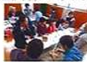
頑張ってっぼう工作 大人気でした!