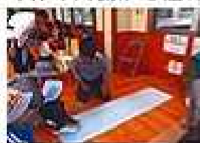
住吉コロリン 楽しかったわ!

秋から冬への移り変わりをいっそう実感するようになりました。気温差が大きな時季です。乳幼児は特に、動きに合わせたこまめな衣類調節が必要となりますね。また、根菜類たっぷりの汁物など食事によって体の内側から温めて風邪予防につなげてあげましょう。