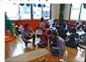
地域の方に 住吉コロリン 教わりました