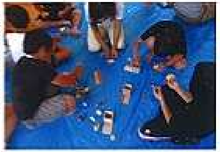
木のぬくもりを感じながらの木工作。自然環境についても教わることができました。

残暑厳しい中、長い夏休みも終わりが近づいてきました。28日の「じどうかんフェスタ」が8月最後のイベントとなりますが、ぜひご家族揃いでお出かけください。9月も遠足はじめ楽しいイベントを企画していますので初めての方もこの機会に参加して親睦を深め、楽しい時間を共有してください。(要予約)