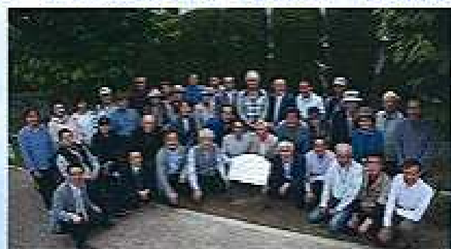
大岡川さくら緑地を育成する会の方々

2011.3.5に「さくら紅豊」を植樹より、本年で丸5年が経ちました。これを機に、後世に残す意義を込め、「さくら・紅豊(べにゆたか)並木」植樹記念碑を建立し、2016.5.8除幕式・記念撮影会を行いました。住吉・城東地区町づくり協議会役員 大岡川さくら緑地を育成する会 住吉音頭を楽しむ会等、大勢の皆様にご参加頂き、盛大に開催することが出来ました。最後に皆で、お祝いの住吉音頭を踊り、記念撮影をしました。