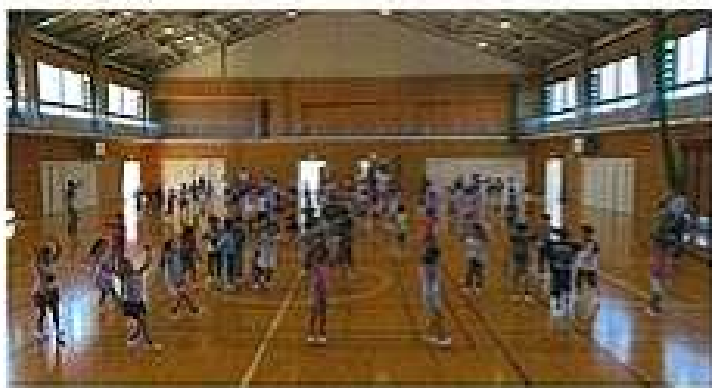
城東小学校の昼休みに 住吉音頭を楽しむ子どもたち 平成28年5月20日同小体育館で