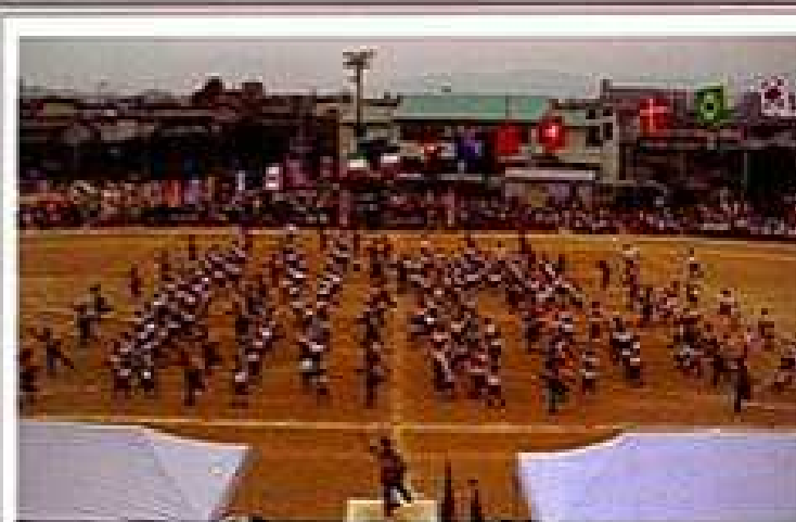
地域の方々に児童や幼稚園児も参加し、「住吉よいとこ住みよいところ」と元気いっぱい踊りました。

中秋の名月を観賞する会を実施。山頂では澄んだ空に月が輝き、歓声がいくつもやかに響きました。あと室内で和