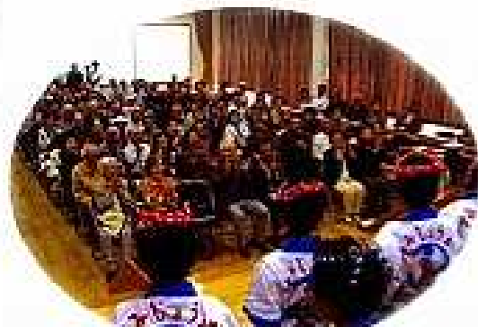
住吉・城東地区のかわいい阿波踊りを楽しみました。