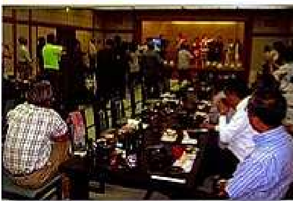
カラオケや住吉音頭踊りもあり、にぎやかなひとときでした。

中秋の名月を観賞する会を実施。山頂では澄んだ空に月が輝き、歓声がいくつもやかに響きました。あと室内で和