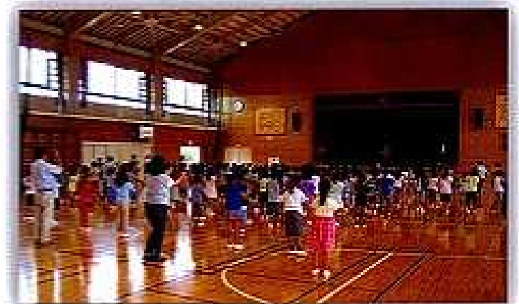
6月30日、城東幼稚園・さくら保育園 城東小学校の住吉音頭交流会(城小体育館)

幼稚園の先生から「子どもたちは、週1回、地域の方に教えていただくこの時間をとても楽しみにしています。住吉音頭の踊りや曲が大好きで、よく口ずさんだり遊びの中で踊っている姿がありました。このような機会をいただき、ありがとうございます。また、住吉老人会の総会、