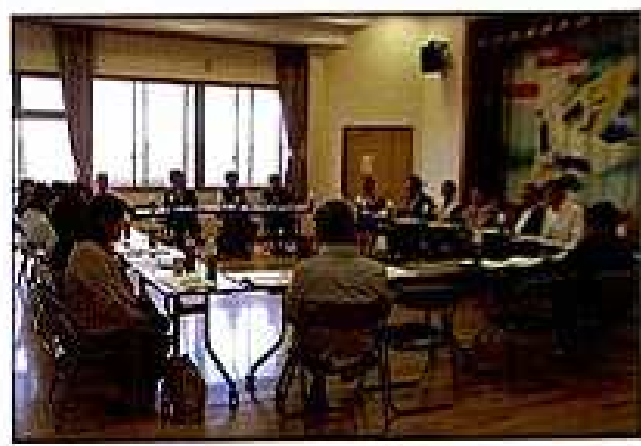
活動計画などを話し合った公民館運営委員会 (H.27.4.30)

住吉・城東公民館運営委員会は、住吉・城東地区町づくり協議会と連携するなかで、地域住民のニーズに柔軟・迅速・的確に応えていくことができるよう、公民館の事業計画をはじめ、施設・設備等の利用などについて協議し、そ