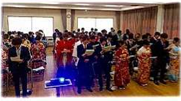
新成人のうた kiroro Best Friend

天候が心配されましたが、穏やかな好天となった3日、阪神・淡路大震災前後に生まれた新成人76名を迎え、地区成人式を行いました。 「両親や周りの人への感謝の気持ち」 「困難に遭遇した時 どう対応するかが問われるかという自覚」 「社会に貢献したい」 「障がいを持たれた方へのケアをしていきたい」 「人とかかわりていきたい」 「支えになっていきたい」 「など、しっかりと語った新成人。その姿から日本の将来も任せられる、そんな安心感を実感できる式典となりました。」 ★成人式おめでとう！★