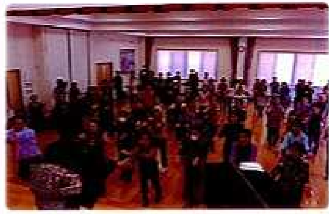
参加者全員で住吉音頭！

1月25日(日)の午後、53年ぶりにリニールした「住吉音頭」お披露目を実施。これからは、毎月第1月曜日午後10時練習会を行います。皆さん一緒に「住吉音頭でエクササイズ」いたしましょう。