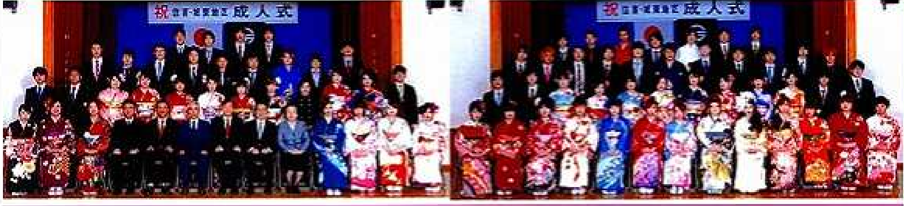
平成27年1月3日(土) 男子39名 女子37名 合計76名参加

発行 住吉・城東地区 町づくり協議会 住吉・城東公民館 住吉 4-4-25 電 656-6570, 6678 住吉・城東地区人口 H.27.1.1 現在 人口 9,453(35人減) 世帯 4,572(19戸減)