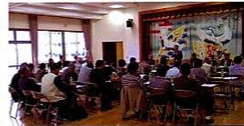
平成26年度町づくり協議会総会(5月14日)

の観点では地域性を生かして、大同川のさくら緑地の育成や住吉千歳の清掃・勉強会等も従来通り行う予定です。さらに、住吉子ども阿波踊り連も従来の地区内だけの活動から一歩踏み出して他地区でもお披露目できるように考え、練習を行っていきたくと思っております。その他、福祉祭りやコミセン祭り、親月会、子ども餅つき大会と年間を通じて多くの行事を予定しております。その都度ご案内を致しますので、ご近所の方も誘いしてご参加くださいますようお願いいたします。