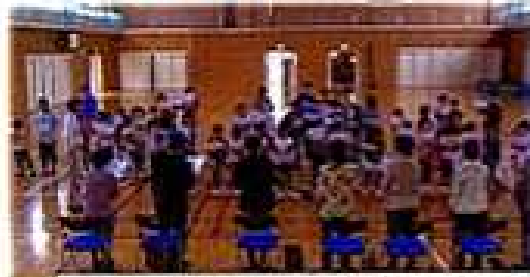
5月14日(水)童謡を歌う