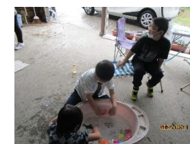
金魚すくいごっこ