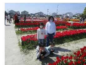
チューリップ公園