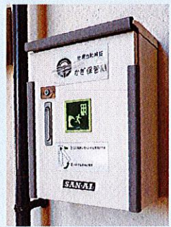
▲方上小学校玄関横