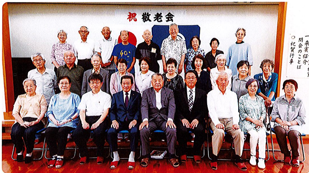
一来賓紹介 閉会のことは 祝賀行事

地域ボランティアの方には、準備会や記念品の配送、当日運営のお手伝いと、ご協力・ご支援を賜りました。心よりお礼申し上げます。