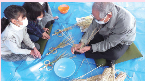
会長さんに教えてもらい、しめ縄作りに挑戦