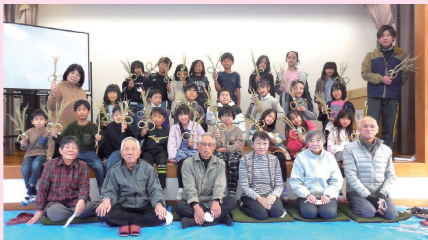
完成したしめ縄飾りを持つての集合写真

五月会の皆さんのご協力で、3年生としめ縄作り、1年生と昔の遊びの活動が、「ふれあい教室」として開催することができました。