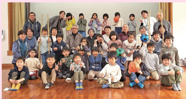
遊んだ道具を持つての集合写真