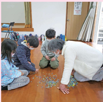
昔の遊び(おはじき)風景