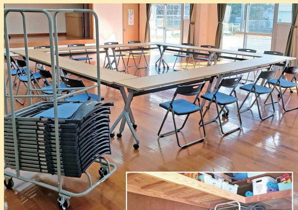
会議用の机椅子セッティング例