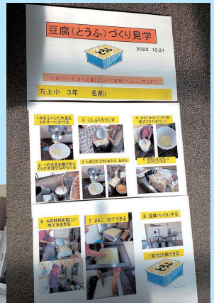
子どもに配布したレジメ