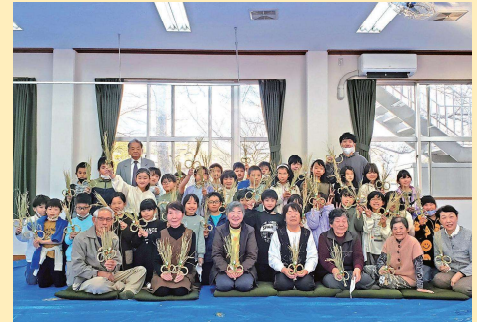
完成したしめ縄飾りを持つての集合写真

五月会の皆さんのご協力で、3年生とはしめ縄作り、1年生とは昔の遊びの活動が、「ふれあい教室」として開催することができました。